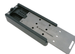
Kaseta do przechowywania mini śrub