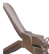
Kleszcze do zaciskania haczyków