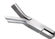
Kleszcze do formowania stopni