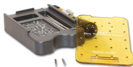
Kasetka do przechowywania śrub mini-vis TAD system