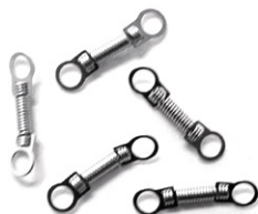
Podwójne sprężynki z oczkami

(Otwór w kształcie gruszki pozwala na łatwe i bezpieczne przymocowanie do śruby z guziczkiem)