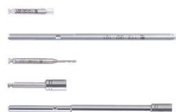
Uchwyt wkrętaka / śrubokręta ręcznego i klucze z końcówkami